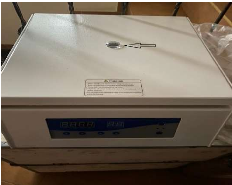
Lotul 79 Ultrasonograf General, Cardiac, performanta înalta Cod 300100

Răspuns: La centrifugă este prezent orificiu. Drept dovadă, anexăm poza produsului. De asemenea, produsul poate fi verificat fizic, acesta fiind în depozitul SC Neotec SRL.